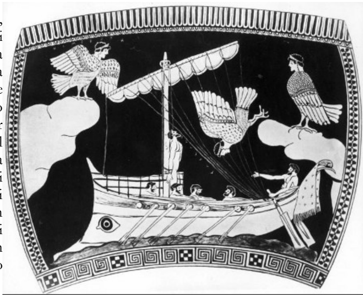
Odisseo e le sirene - Rappresentazione su ceramica (475 a.C.)

Perché, presso gli Antichi, nessun vivente poteva varcare i limiti dell'oltretomba senza correre enormi rischi e, se era relativamente agevole giungere a destinazione superando sinistre avversità, era per contro più difficile uscirne. Il cane Cerbero (bisogna ricordarlo?) lasciava entrare gli stranieri ma si metteva di traverso sulla loro strada non appena fossero tentati di andarsene. La Sibilla mette in guardia Enea contro questo pericolo: