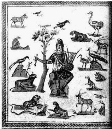
Orfeo suona la lira, Mosaico pavimentale romano, II secolo d.C., Museo archeologico, Palermo, Sicilia (Italia)

Si impiega di solito il termine catabasi per designare, in maniera tecnica, uno dei motivi ricorrenti dei miti e della letteratura antica: la discesa effettuata da un eroe nelle viscere della terra, verso il Regno dei Morti. Quattro personaggi illustri hanno così calcato le terre Infernali: