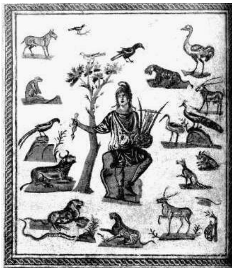
Orfeo suona la lira, Mosaico pavimentale romano, II secolo d.C., Museo archeologico, Palermo, Sicilia (Italia)

Si impiega di solito il termine catabasi per designare, in maniera tecnica, uno dei motivi ricorrenti dei miti e della letteratura antica: la discesa effettuata da un eroe nelle viscere della terra, verso il Regno dei Morti. Quattro personaggi illustri hanno così calcato le terre Infernali: